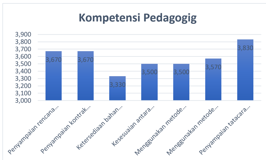
Gambar 3.1 Diagram kepuasan mahasiswa terhadap kinerja dosen dengan indikator kompetensi pedagogig

Hasil survey kepuasan mahasiswa terhadap pembelajaran yang dilakukan oleh dosen untuk kompetensi pedagogig ditunjukkan pada gambar 3.1